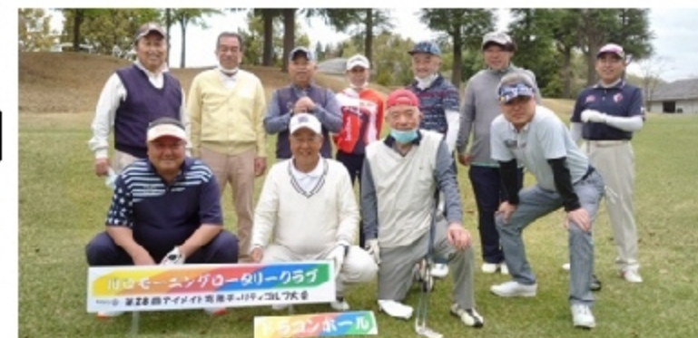
第28回アイメイト(盲導犬)寄贈チャリティゴルフ大会が4月5日に開催されました。