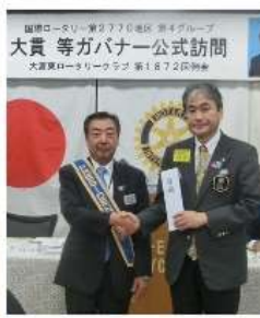
啓・アイバンクの協賛金目録を当クラブより贈呈しました。